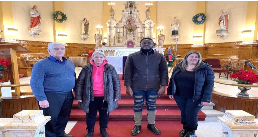
Photo de NOS NOUVEAUX MAGES , nos nouveaux marguilliers et marguillières !

Bienvenue et surtout Merci de tout cœur !