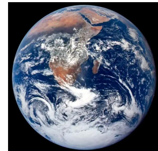
La NASA publie une image spectaculaire de la TERRE depuis ARTÉMIS II

Merci de nous mettre ainsi en communion, dans le respect les uns des autres. Amen.