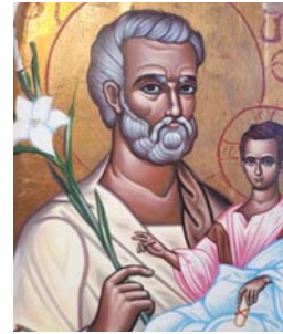
19 Saint Joseph