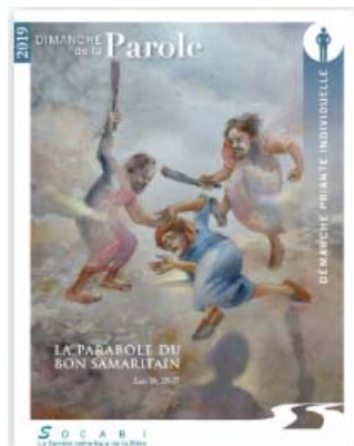
Démarche priante individuelle