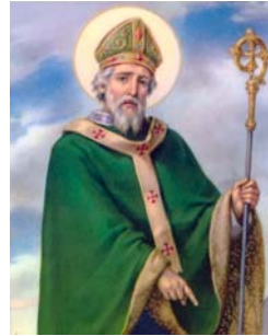
17 Saint Patrick