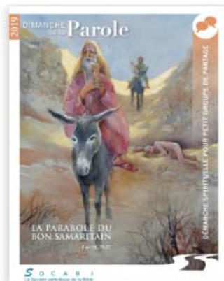
Démarche spirituelle pour petit groupe