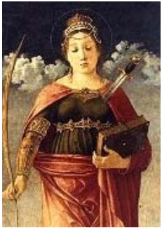
12 Sainte Justine