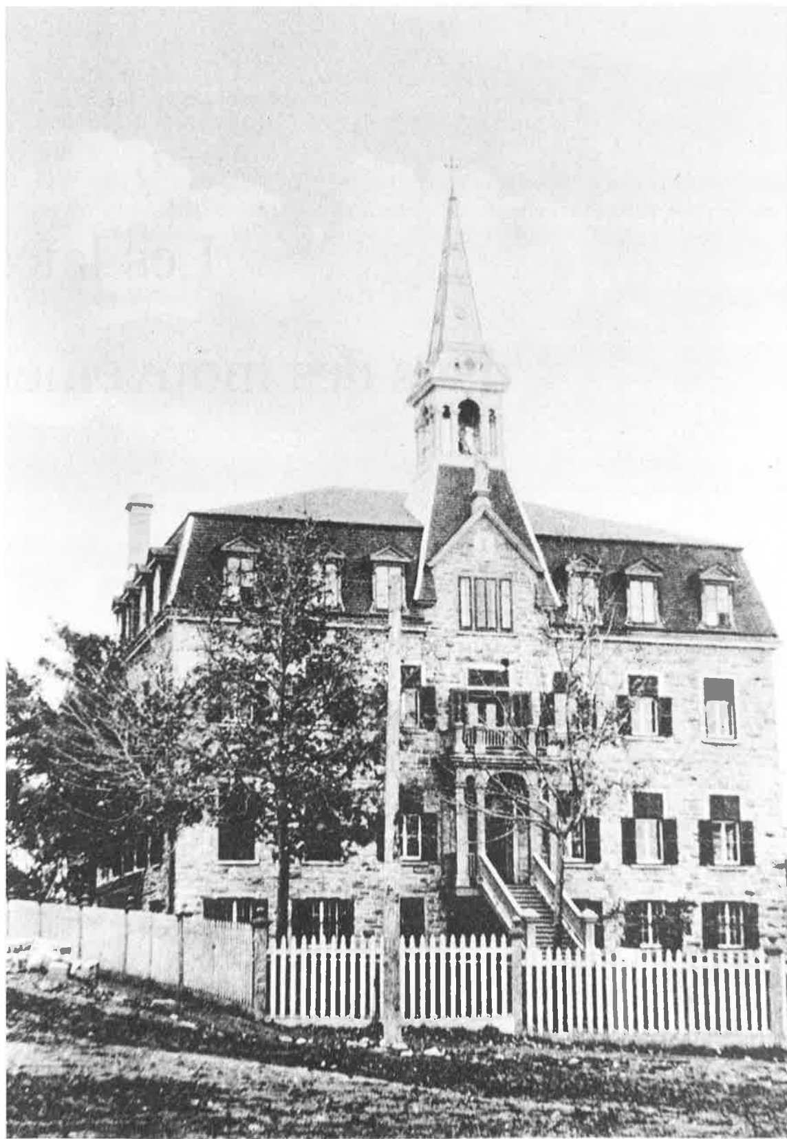
Couvent des soeurs des Saints Noms de Jésus et de Marie de Saint-Timothée.